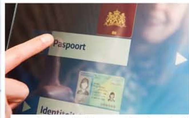
3 De aanmeldzuil heeft een scanner, die zowel paspoorten, identiteitskaarten als rijbewijzen kan scannen. Let er wel op dat het identiteitsbewijs op de juiste manier in de scanner wordt gelegd.