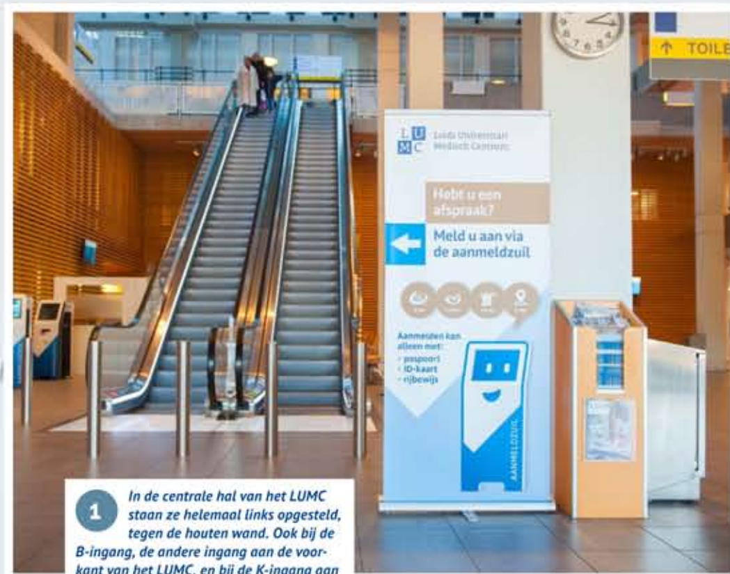
1 In de centrale hal van het LUMC staan ze helemaal links opgesteld, tegen de houten wand. Ook bij de B-ingang, de andere ingang aan de voorkant van het LUMC, en bij de K-ingang aan de achterkant staan aanmeldzuilen.

TEKST: HESTER SLEEKING