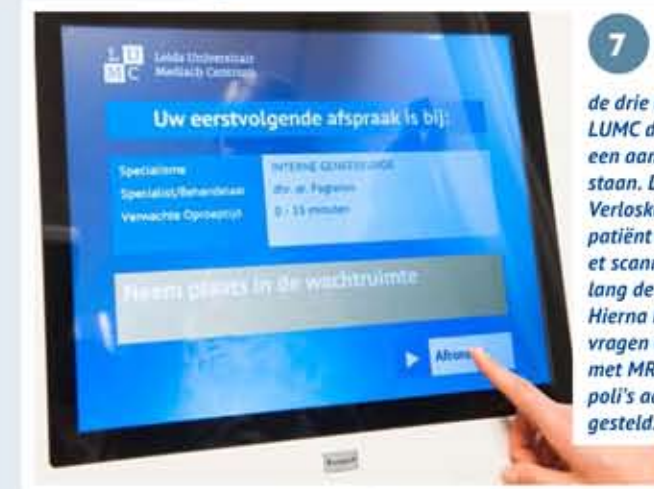
7 De poli van Interne Geneeskunde is op dit moment één van de drie eerste poli's in het LUMC die bij de ingang ook een aanmeldzuil hebben staan. De andere twee zijn Verloskunde en Urologie. De patiënt kan hier het dagticket scannen en ziet dan hoe lang de wachttijd zal zijn. Hierna krijgt de patiënt vier vragen over mogelijk contact met MRSA, die bij de overige poli's aan de balie worden gesteld.