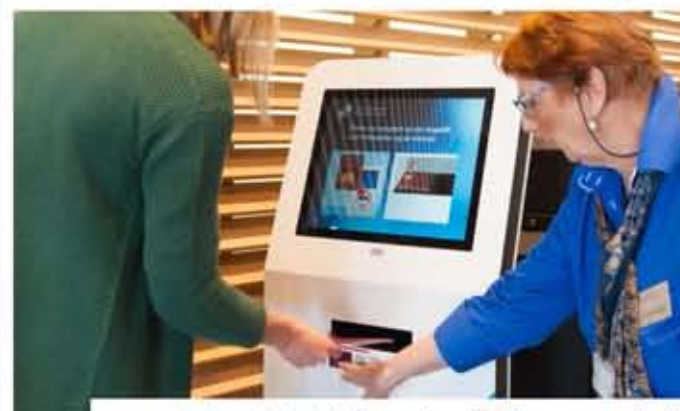
4 In de centrale hal zijn overdag vrijwilligers aanwezig, die graag helpen bij het aanmelden via de zuilen. Na het scannen van de legitimatie kunt u uw gegevens controleren.