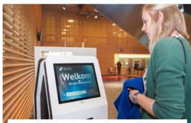
2 Patiënten met een afspraak op een polikliniek, de Centrale Bloedafname of radiologie kunnen zich aanmelden bij de zuilen.

Op het moment dat u zich bij de zuil aanmeldt, bekijkt de aanmeldzuil welke volgorde van afspraken voor u het handigst is. Zo bespaart u tijd en hoeft u minder lang te wachten.