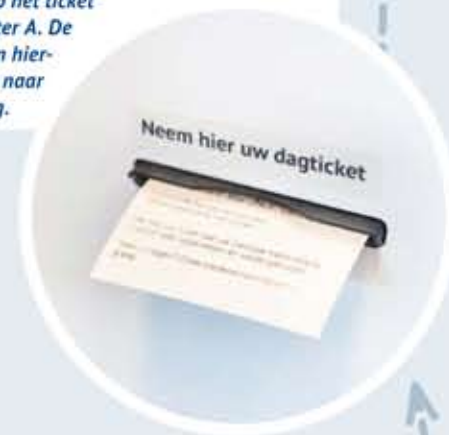
5 Na de aanmelding rolt er een dagticket uit de aanmeldzuil. Als alle gegevens compleet zijn, begint het nummer op het ticket met de letter A. De patiënt kan hiermee direct naar de afdeling.