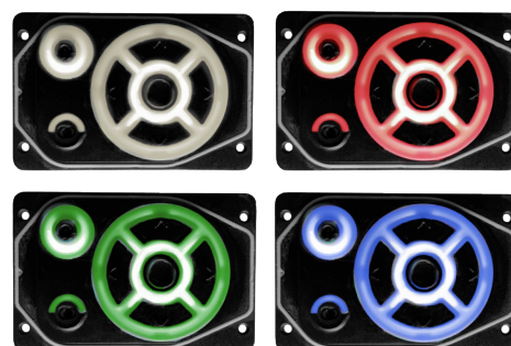
Voorbeelden van kleurvarianten van de verlichting